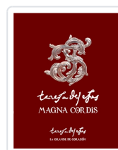
Teresa de Jesús: Magna Cordis. La Grande de Corazón Miguel Ángel González González coord