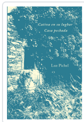
Cativa en su lughar / Casa pechada Pichel, Luz