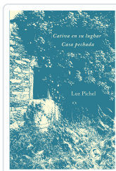
Cativa en su lugar / Casa pechada Pichel, Luz