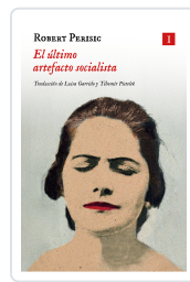
El último artefacto socialista Perišić, Robert