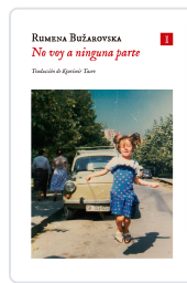
No voy a ninguna parte Bužarovska, Rumena