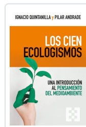
Los cien ecologismos Quintanilla Navarro, Ignacio; Andrade Boué, Pilar