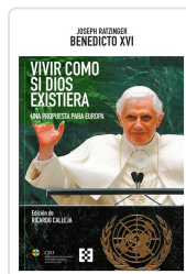
Vivir como si Dios existiera Ratzinger (Benedicto XVI), Joseph