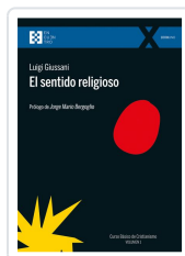
El sentido religioso Giussani, Luigi