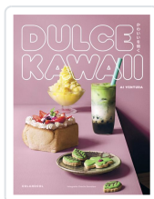
Dulce kawaii Ventura, Ai