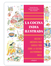
La cocina india ilustrada Pankaj Sharma, Sandra Salmandjee