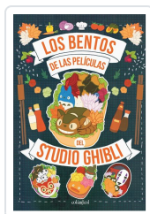
Bentos de las películas del Studio Ghibli, Los Azuki