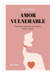
Amor vulnerable Sabaté, Laia