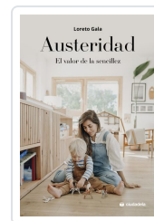
Austeridad Gala, Loreto