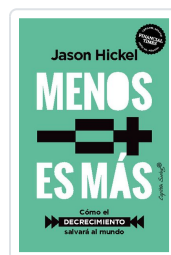
Menos es más Hickel, Jason