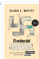
El orden del capital Mattei, Clara E.