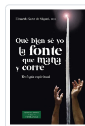
Qué bien sé yo la fonte que mana y corre. Teología espiritual Eduardo SANZ DE MIGUEL, OCD