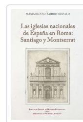
Las iglesias nacionales de España en Roma en Roma