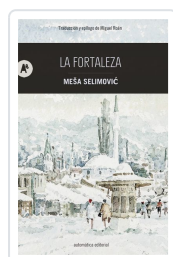
La fortaleza Selimovic, Meša