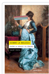
Sobre la belleza. Entre la Venus y el Ciborg Naïef Yehya