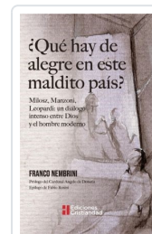
¿Qué hay de alegre en este maldito país? Nembrini, Franco