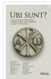
Ubi Sunt? Intellectuales cristianos