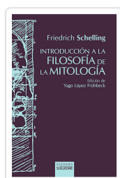
Introducción a la filosofía de la mitología Schelling, Friedrich Wilhelm Joseph