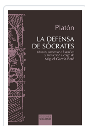
La defensa de Sócrates Platón