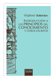
Introducción a los principios del conocimiento y otros escritos Vladimir Soloviov