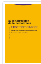
La construcción de la democracia Ferrajoli, Luigi