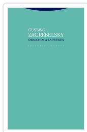
Derechos a la fuerza Zagrebelsky, Gustavo