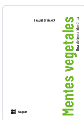
Mentes vegetales. una defensa filosófica Maher, Chauncey