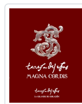
Teresa de Jesús: Magna Cordis. La Grande de Corazón Miguel Ángel González González coord