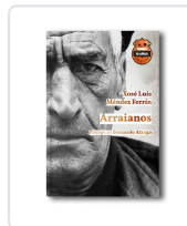
Arraianos. Ed. 10 Aniversario Méndez Ferrín, Xosé Luís