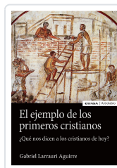
EJEMPLO DE LOS PRIMEROS CRISTIANOS Larrauri Aguirre, Gabriel