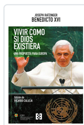
Vivir como si Dios existiera Ratzinger (Benedicto XVI), Joseph