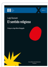
El sentido religioso Giussani, Luigi