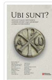
Ubi Sunt? Intelectuales cristianos