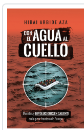
Con el agua al cuello Arbide Aza, Hiba