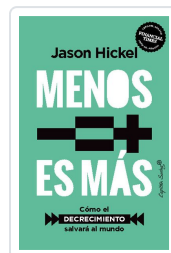
Menos es más Hickel, Jason