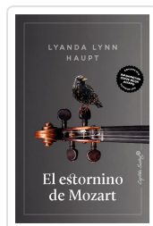
El estornino de Mozart Lynn Haupt, Lyanda