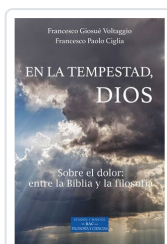
En la tempestad, Dios Francesco Giosuè