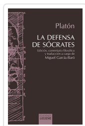
La defensa de Socrates Platón