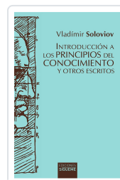
Introducción a los principios del conocimiento y otros escritos Vladimir Soloviov