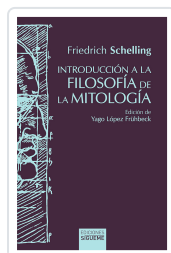
Introducción a la filosofía de la mitología Schelling, Friedrich Wilhelm Joseph