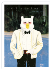
Café Romántica Hanselmann, Simon