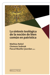
La síntesis teológica de la noción de bien común en patristica Varios autores