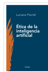
Ética de la inteligencia artificial Floridi, Luciano