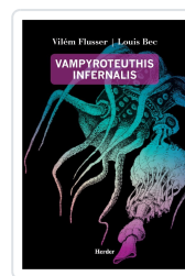
VAMPYROTEUTHIS INFERNALIS FLUSSER, VILEM / BEC, LOUIS