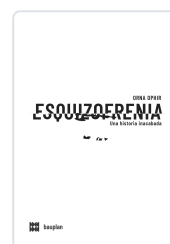
Esquizofrenia. Una historia inacabada Ophir, Orna