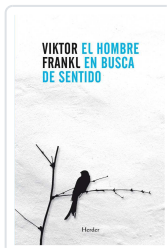
El hombre en busca de sentido Frankl, Viktor Emil