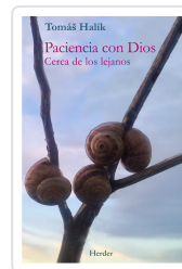
Paciencia con Dios Tomás Halik