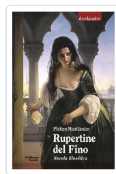
Rupertine. Novela filosófica Mainländer, Philipp