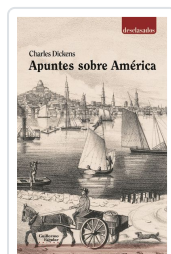
Apuntes sobre América Dickens, Charles