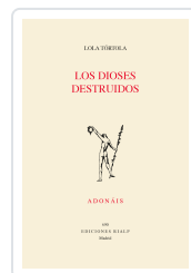
Los dioses destruidos Tórtola, Lola