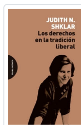
Los derechos en la tradición liberal Shklar, Judith N.