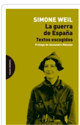
La guerra de España Weil, Simone