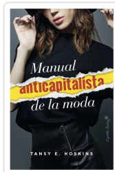
Manual anticapitalista de la moda Hoskins, Tansey E.