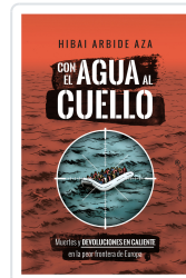
Con el agua al cuello Arbide Aza, Hibaí