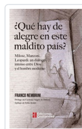
¿Qué hay de alegre en este maldito país? Nembrini, Franco