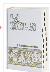
La Biblia Latinoamérica [letra grande] cartoné blanca, con uñeros Bernardo Hurault (trad.)