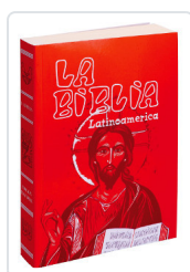
La Biblia Latinoamérica [letra normal] rústica Bernardo Hurault (trad.)