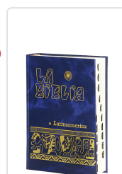
La Biblia Latinoamérica [bolsillo] cartoné color, con uñeros Bernardo Hurault (trad.)