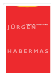
TIEMPO DE TRANSICIONES (1ª REIMPRESIÓN) HABERMAS, JÜRGEN