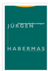
FRAGMENTOS FILOSÓFICO-TEOLÓGICOS (1ª R.) HABERMAS, JÜRGEN