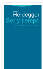
Ser y tiempo Heidegger, Martin