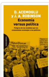
Economía versus política Acemoglu, Daron; Robinson, James A.