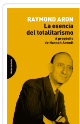
La esencia del totalitarismo Aron, Raymond