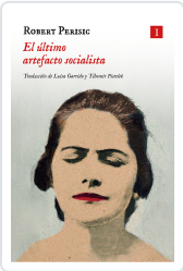
El último artefacto socialista Perišić, Robert