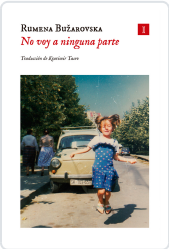
No voy a ninguna parte Bužarovska, Rumena