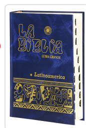
La Biblia Latinoamérica [letra grande] cartóné, con uñeros Bernardo Hurault (trad.)