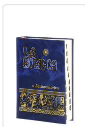
La Biblia Latinoamérica [bolsillo] cartóné color, con uñeros Bernardo Hurault (trad.)