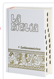
La Biblia Latinoamérica [letra grande] cartóné blanca, con uñeros Bernardo Hurault (trad.)