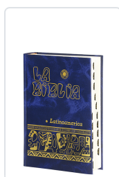
La Biblia Latinoamérica [bolsillo] cartóné color, con uñeros Bernardo Hurault (trad.)