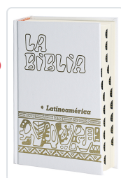
La Biblia Latinoamérica [letra grande] cartóné blanca, con uñeros Bernardo Hurault (trad.)