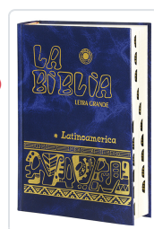
La Biblia Latinoamérica [letra grande] cartóné, con uñeros Bernardo Hurault (trad.)