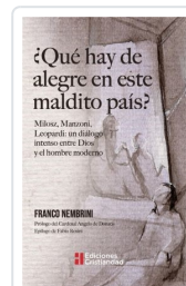
¿Qué hay de alegre en este maldito país? Nembrini, Franco