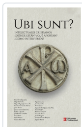
Ubi Sunt? Intellectuales cristianos