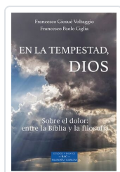
En la tempestad, Dios Francesco Giosuè