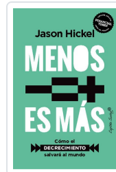
Menos es más Hickel, Jason