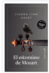
El estornino de Mozart Lynn Haupt, Lyanda