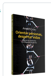
Orientar personas, despertar vidas Anselm Grün