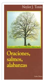
Oraciones, salmos, alabanzas Neylor J. Tonin