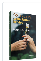
Cómo sanar sentimientos heridos Martin H. Padovani