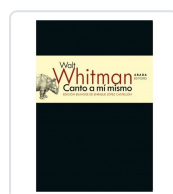
Canto a mí mismo Whitman, Walt