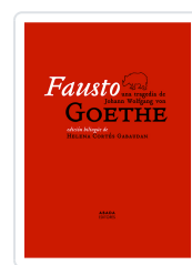
Fausto Goethe, Johann Wolfgang von