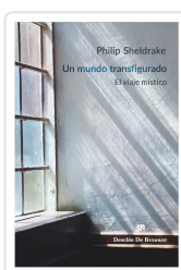
Un mundo transfigurado. El viaje místico Sheldrake, Philip