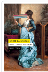
Sobre la belleza. Entre la Venus y el Ciborg Naief Yehya