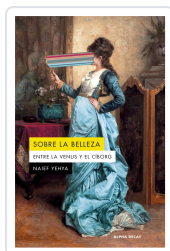
Sobre la belleza. Entre la Venus y el Ciborg Naief Yehya