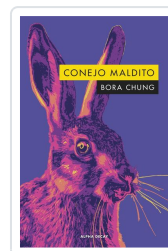
CONEJO MALDITO Chung, Bora