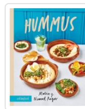
Hummus Malin y Nimrod Regev