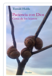
Paciencia con Dios Tomás Halik