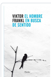
El hombre en busca de sentido Frankl, Viktor Emil